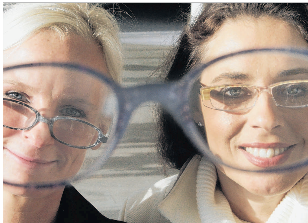
Der Schaden an einer Brille ist zwar ärgerlich, ist aber kein Risiko, das die finanzielle Existenz gefährden könnte.